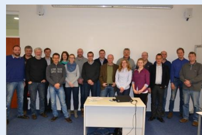
Projektteilnehmer der OG Milch (Stand: Januar 2016)

Eine Kernfrage in der Milchviehhaltung: wie viel kg Trockensubstanz fressen meine Tiere täglich?