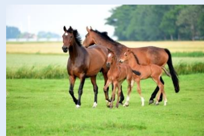
Bild 2: Erhebung von Haltungs- und Managementkenngößen auf pferdehaltenden Betrieben