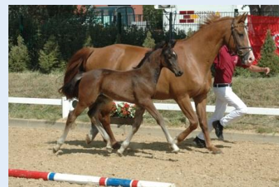
Bild 1: Alle Fohlen und Stuten wurden auf den Zuchtveranstaltungen linear beschrieben

Die beiden Online-Anwendungen sind auf der Startseite und im Bereich EIP-Projekt auf der Internetseite des Holsteiner Verbandes ( www.holsteiner-verband.de ) zu finden.