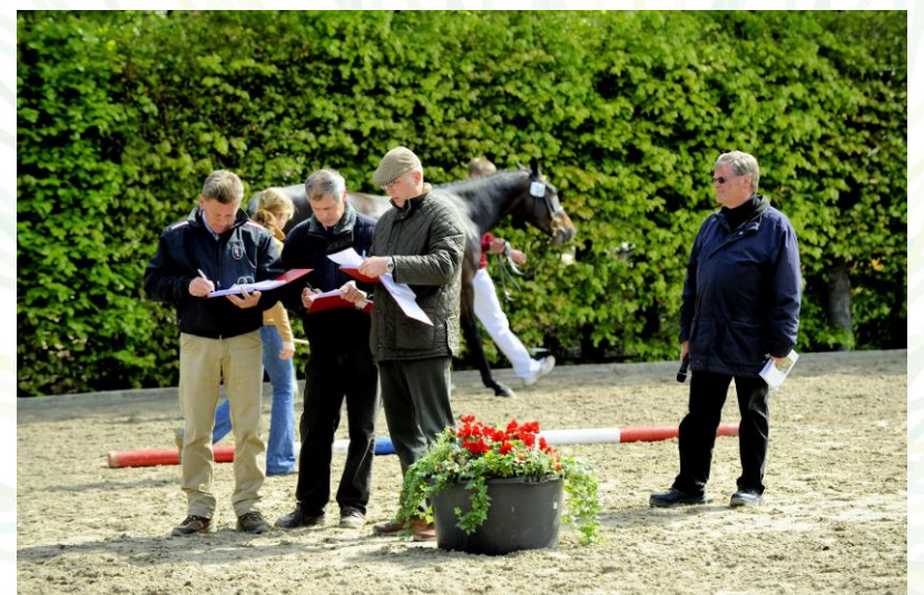
Lineare Beschreibung der Junghengste