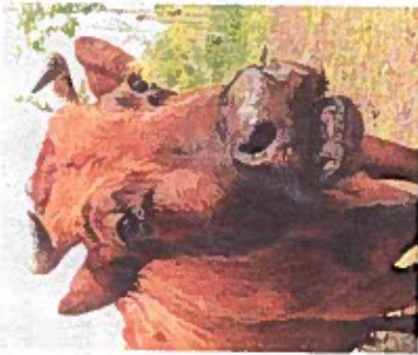
Klimafest und langlebig: Vom Angler Rind alter Zuchtrichtung gibt es nur noch 400 Exemplare.

„Die Arche Warder ist ein sehr besonderer Ort in