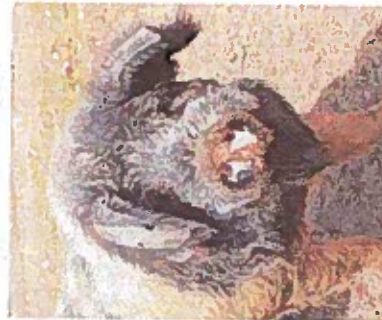
Geährdet: Das Angler Sattelschwein steht oben auf der Roten Liste bedrohter Nutztierassen.

Schleswig-Holstein“, befand Silke Schneider beim „Open Projekt Day“ im Tierpark, „sie ist ein Leuchtturmprojekt nicht nur für unser Bundesland, sondern deutschlandweit.“ Die Staatssekretä-