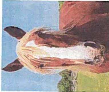
Gutmütiger Kraftprotz: Der Bestand des Schleswiger Kaltbluts hat sich erholt. KÜHL (3)